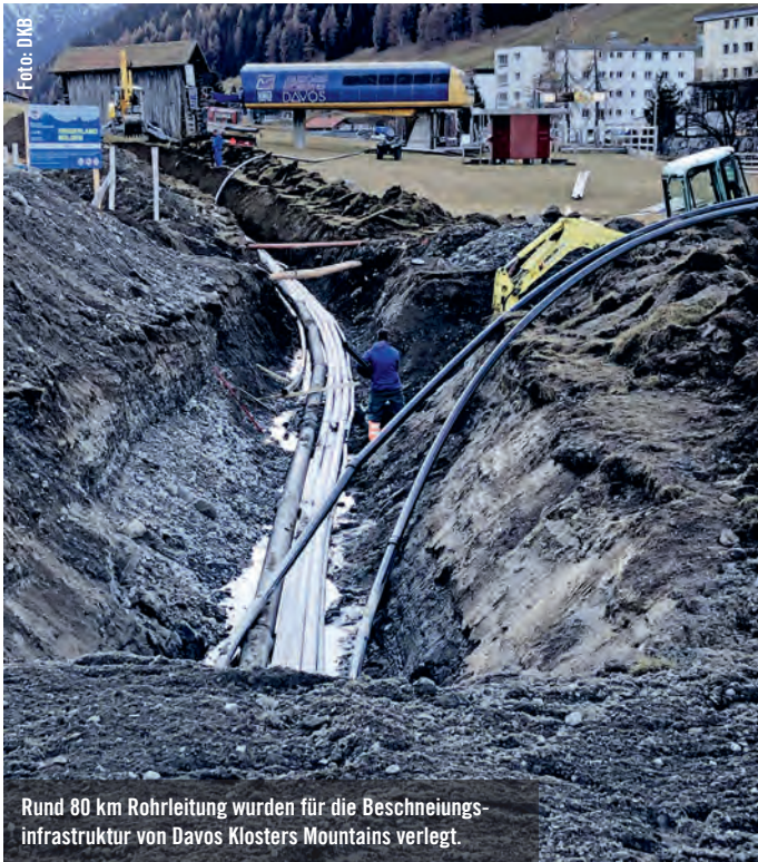
Rund 80 km Rohrleitung wurden für die Beschneigungsinfrastruktur von Davos Klosters Mountains verlegt.