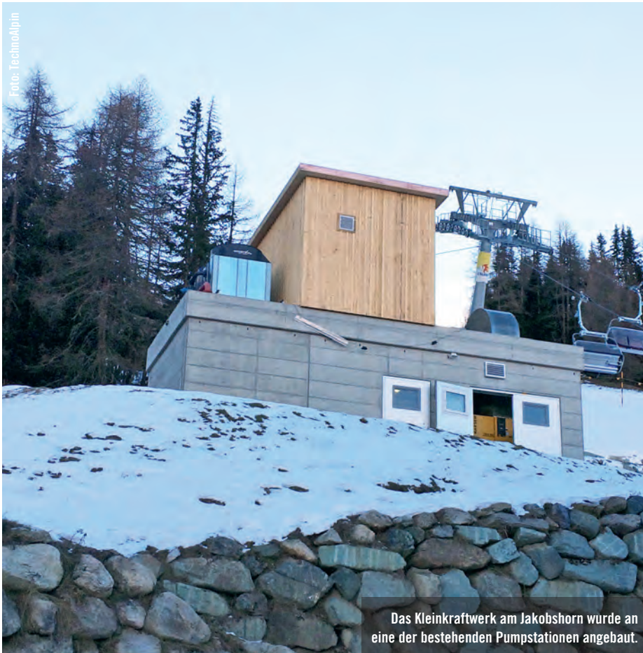
Das Kleinkraftwerk am Jakobshorn wurde an eine der bestehenden Pumpstationen angebaut.