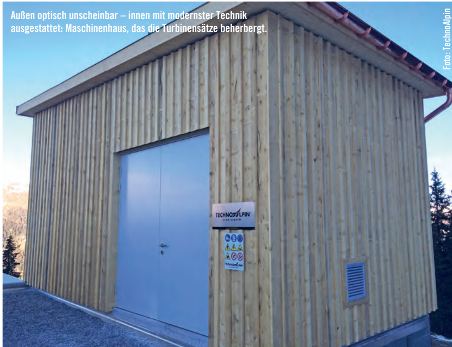
Außen optisch unscheinbar – innen mit modernster Technik ausgestattet: Maschinenhaus, das die Turbinensätze beherbergt.