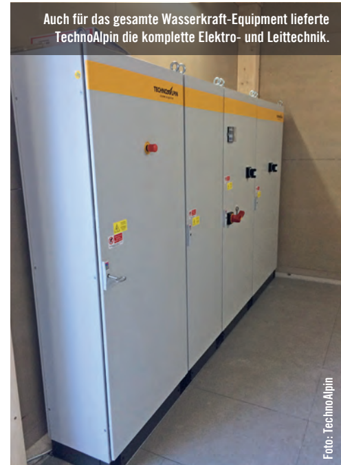
Auch für das gesamte Wasserkraft-Equipment lieferte TechnoAlpin die komplette Elektro- und Leittechnik.